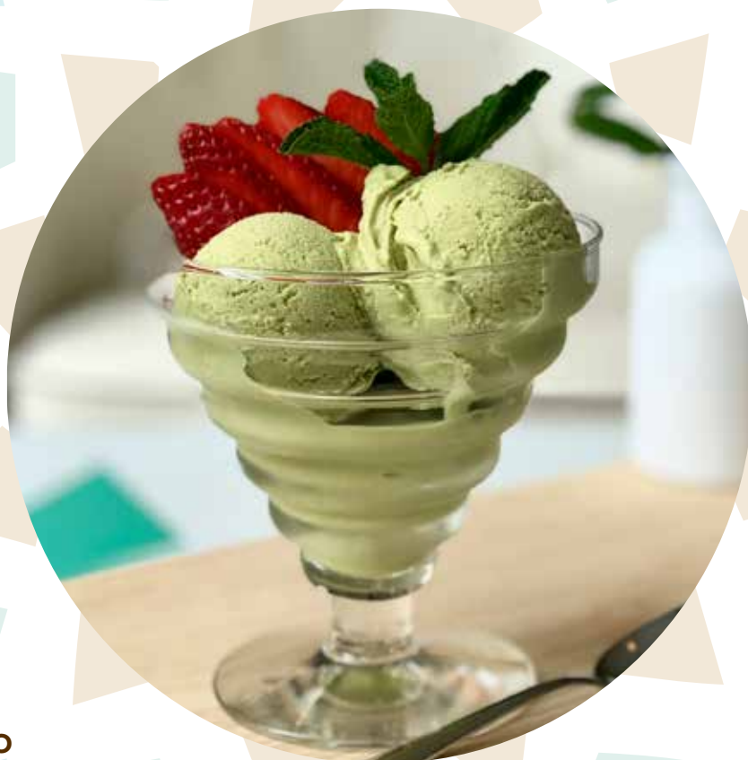
Helado Té Verde Matcha Matcha tea ice cream